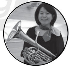
高木 理恵 バリトン Rie Takagi *Baritone