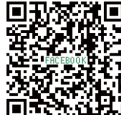
Facebook (フェイスブックページ)