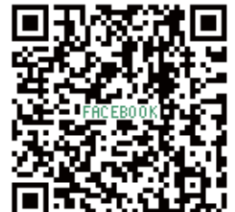
Facebook (フェイスブックページ)